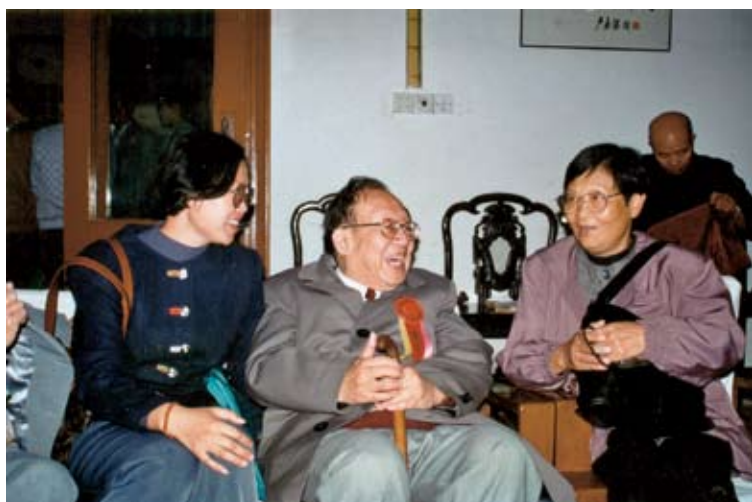
1998年12月，吴征镒院士来仙湖植物园，与仙湖植物园李沛琼研究员（右）和李楠博士（左）亲切交谈